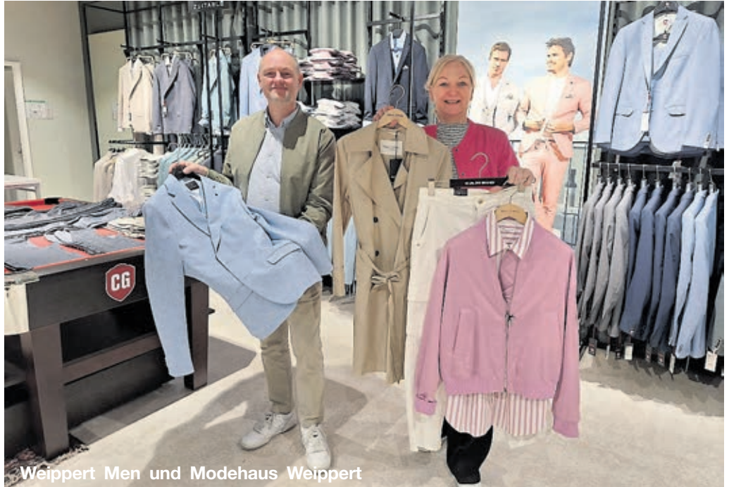
Weippert Men und Modehaus Weippert