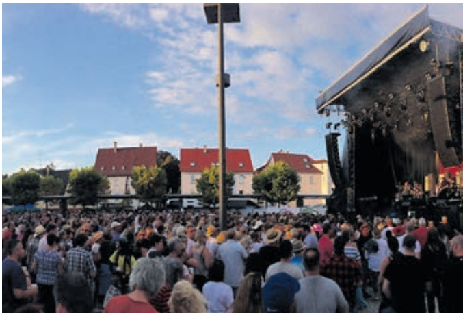
Neckarfest, Gauklerfest, Sommer Open Air – das sind nur einige der Programmhightlights im Rottenburger Jahreskalender.

Grill & Chill in der Rottenburger Innenstadt nicht nur bis 22 Uhr eingekauft, sondern auch ganz gemütlich geschlemmt werden. Vom 28. bis 30. Juni stehen beim 49. Rottenburger Neckarfest die Vereine und die Bürger im Vordergrund. Das ganze Wochenende verwandelt sich das Festgelände entlang des Neckars in eine Festmeile mit spannender Unterhaltung, Open-Air-Konzerten für alle Altersgruppen, Mitmachaktionen und einem kunterbunten Essens- und Getränkeangebot. Die zehn Neckarfest-Flöße stehen in diesem Jahr nach dem Fest eine weitere Woche für gesellige Abende am Neckarufer zur Verfügung – sei es im Rahmen eines Firmenevents oder privat unter Freunden. Informationen zu Reservierungen werden in Kürze veröffentlicht.