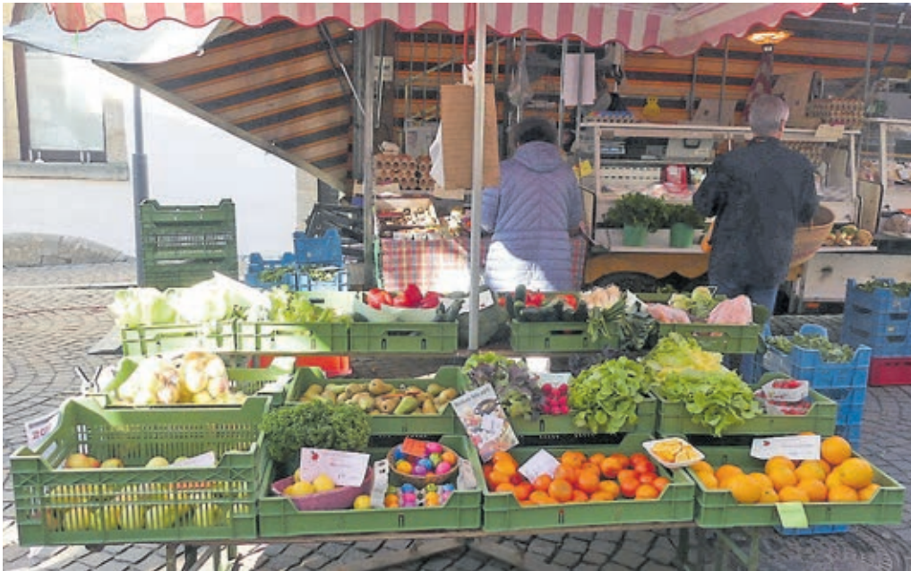
Alles frisch für eine gesunde Küche – und pünktlich zu Ostern dürfen natürlich auch die gefärbten Eier nicht fehlen.