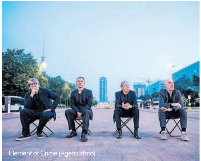
Element of Crime