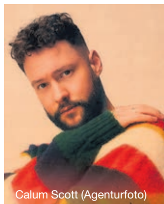
Calum Scott

Nach einer fulminanten ausverkauften Tournee im Spätsommer und Herbst 2023 durch die Konzerthäuser von Deutschland, Österreich und Schweiz kommen Element of Crime am Freitag, 30. August, nach Rottenburg. Das wird ein ganz besonderer Abend, wenn nacheinander die blaue Stunde, die Dämmerung und schließlich die einbrechende Nacht von den melancholisch-optimistischen Liedern dieser unverwechselbaren Band untermalt werden.