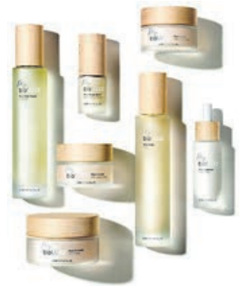
Die Behandlungen bei Face to Face erfolgen in Kombination mit speziell ausgesuchten Produkten.

Buchen Sie jetzt Ihren ersten persönlichen Beratungs- und / oder Behandlungstermin und starten Sie Ihre ganzheitliche Reise zu zeitloser Schönheit und unwiderstehlichem Charisma. Rufen Sie uns an oder besuchen Sie unsere Webseite für weitere Informationen.