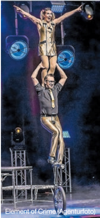
Element of Crime