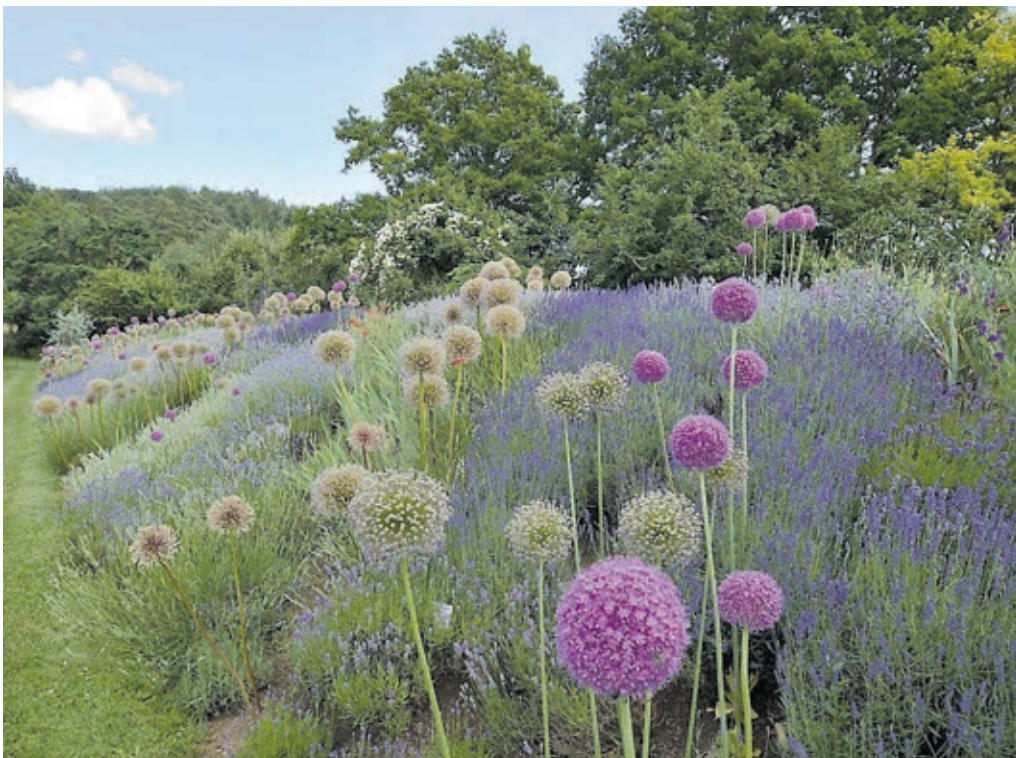
Impression aus dem Landschaftsgarten von Roland Doschka: Im späten Frühjahr thronen die riesigen Allium-Kugeln über den Lavendel-Kissen, hier in Szene gesetzt durch den Rottenburger Fotografen Hermann Kurz.